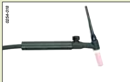
Torche TIG à valve