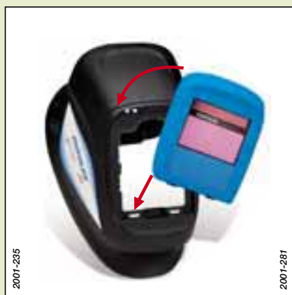
Masque EUROLUX Jet à cassettes-filtres interchangeables